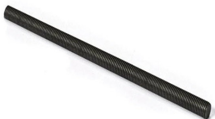
Varilla roscada DIN 975 8.8 Sin baño