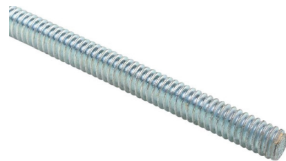
DIN 975 8.8 Zincado