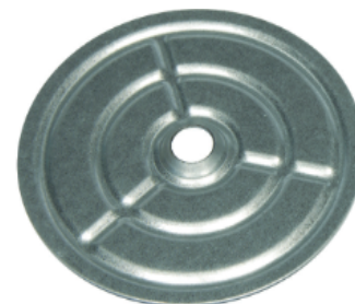
Arandela de repartición DRK Ø 70