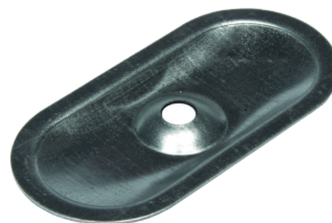
Arandela de repartición DRK 82x 40