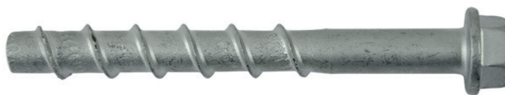
Anclaje TURBO FIX Cabeza hexagonal.

- Para la fijación de estructuras de acero, barandillas, escaleras, portones, máquinas