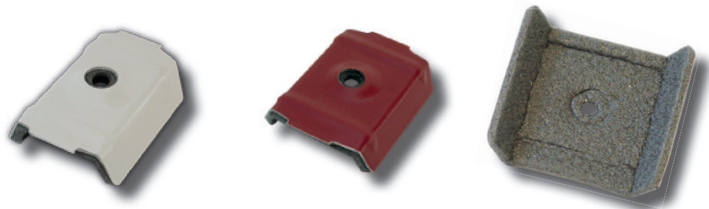
Caballote para chapa grecada con polietileno.